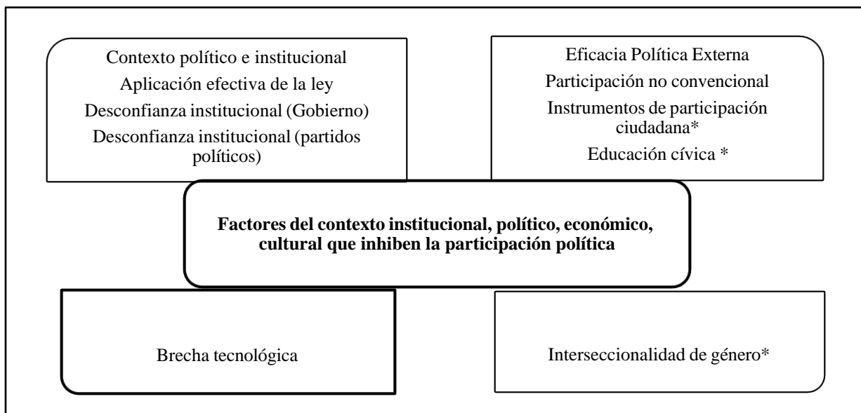
Figura 2. Contextos.

Las principales causas que inhiben la participación política de los ciudadanos están relacionadas con el desempeño del sistema, tanto de las instituciones como de los partidos y actores políticos. Ello crea en los individuos la sensación de rechazo y desconfianza hacia las instancias gubernamentales y las organizaciones partidarias, por una parte, y por la otra, a que cuando participan o plantean sus demandas irresueltas utilizan instrumentos no convencionales. El estudio de campo arrojó las siguientes opiniones: