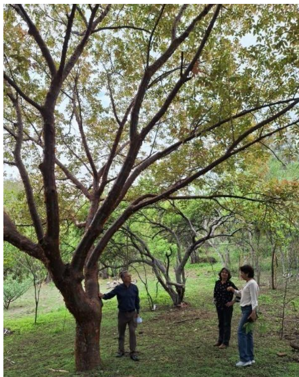
Figura 3. Ejemplar de B. roseana en el JB-UAGro.

El endemismo es un concepto para identificar grupos biológicos con áreas de distribución restringida. Una especie endémica es aquella que evolucionó en un lugar y sólo es posible encontrarla de forma natural en dicho lugar,